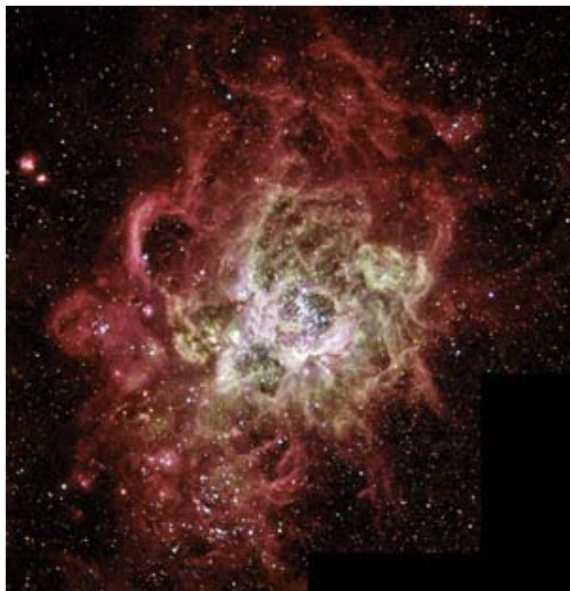
M 33. NGC 604 ist der größte Emissionsnebel der Galaxie. Hubble Space Telescope.