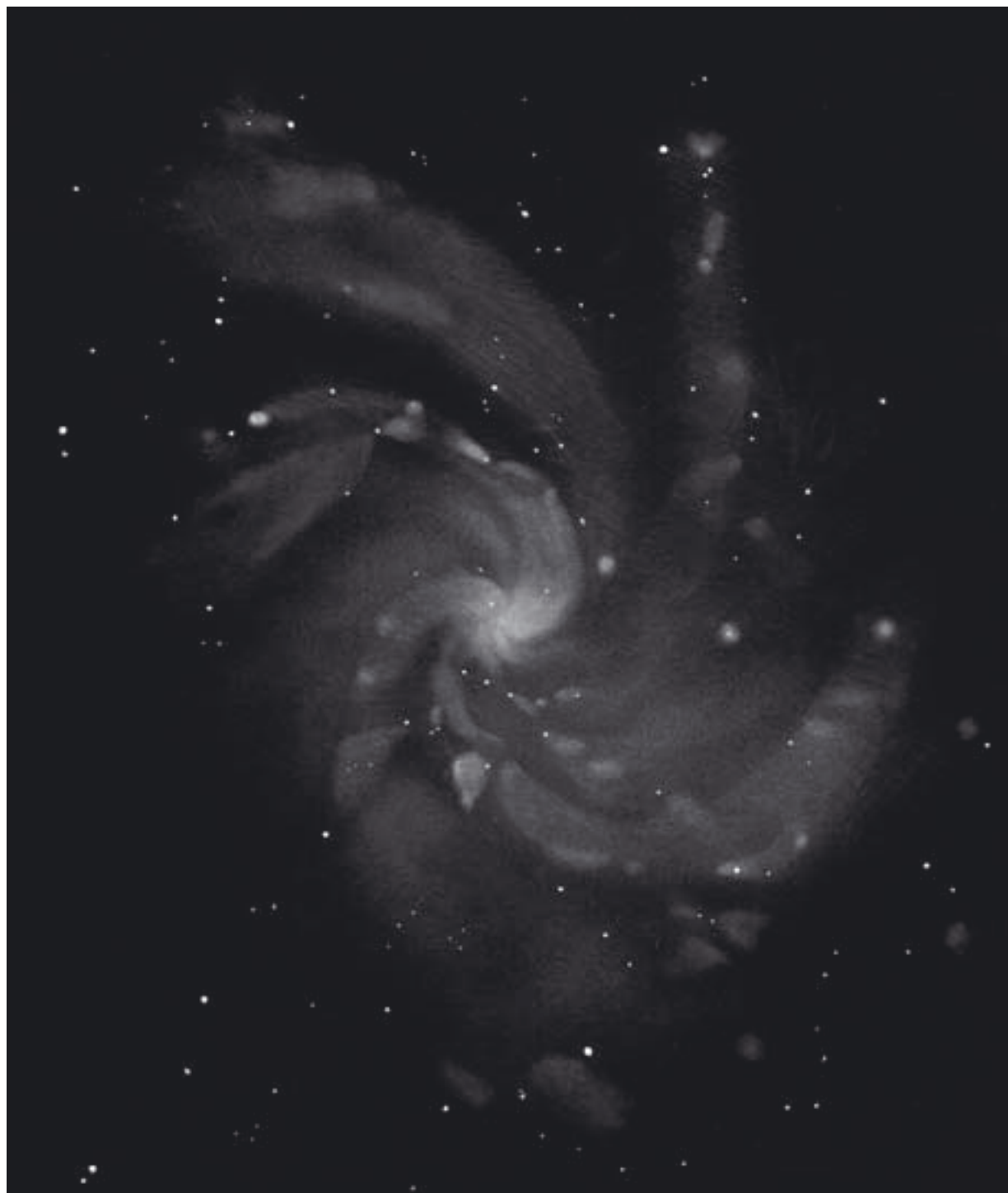
M 33. Zeichnung, 14"-Newton, Ronald Stoyan.

Sternhaufen mit einem kleinen Sternchen am Südrand, und NGC 588, einem recht hellen Nebel mit stellarem Kern. Beide Objekte sind schwierig auch schon mit 4,7" sichtbar. Südwestlich von NGC 588 ist östlich eines hellen Feldsterns das diffuse Gebiet von A 131 zu sehen, nördlich von NGC 592 die zwei kleinen Kleckse von A 28 und IC 131. Etwa 18' nordwestlich des Kerns von M 33 findet man noch das isolierte Gebiet von IC 132 und IC 133, mit zwei kleinen Sternchen südlich des nördlicheren Nebelflecks, der im Nebelfilter seine Emissionsnatur offenbart.