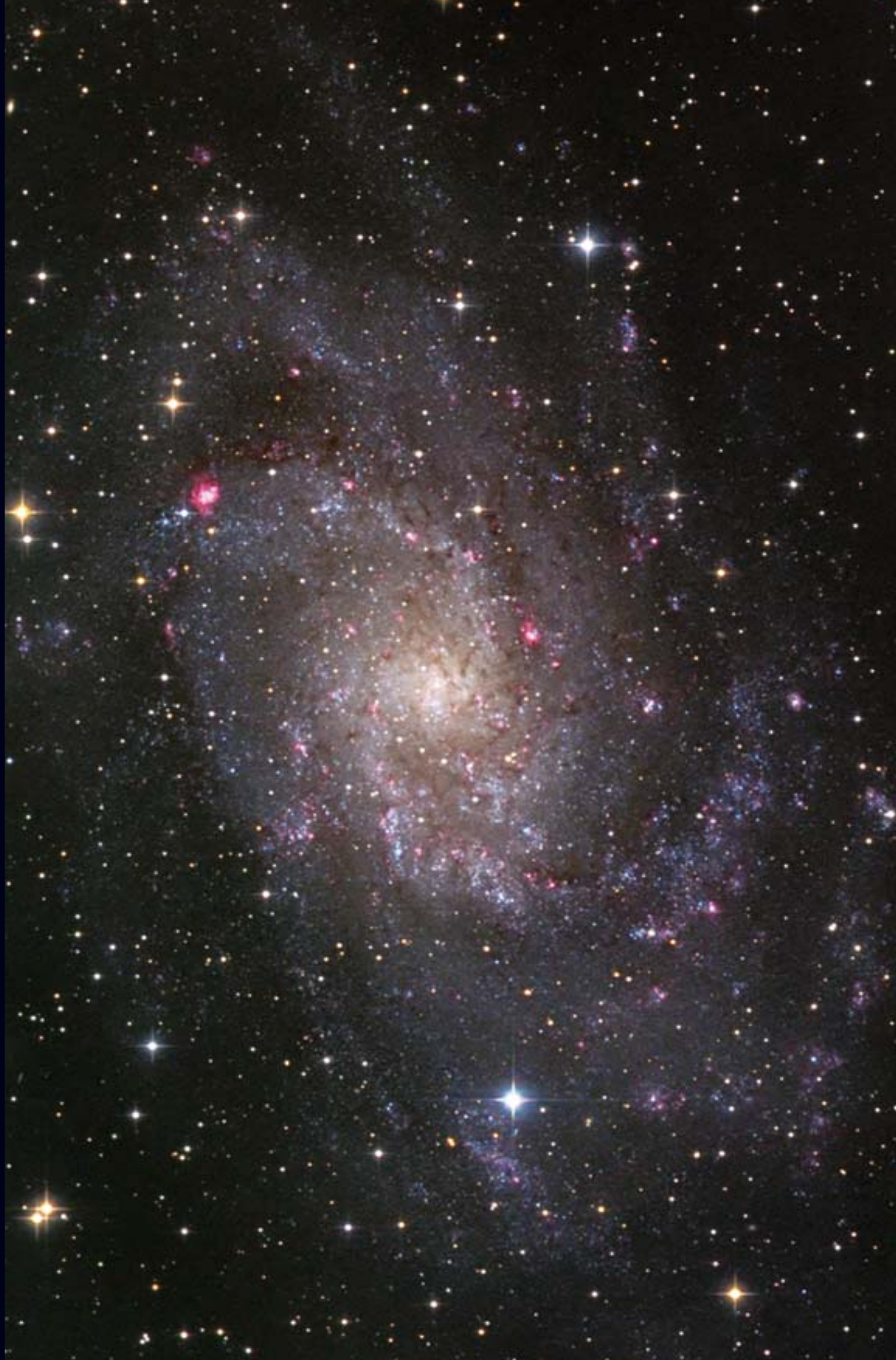
M 33 ist eine fotografisch wie visuell beeindruckende Spiralgalaxie der Lokalen Gruppe. Cord Scholz.